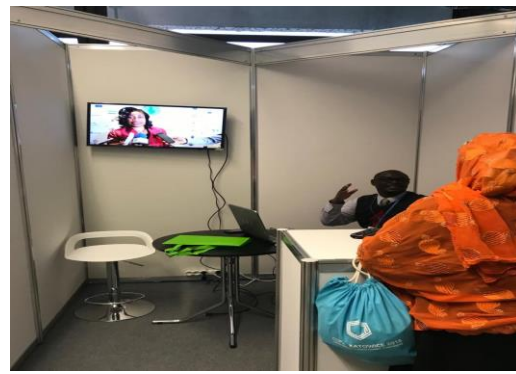
Présentation des activités du SG de la CEEAC

Des consultations ont également eu lieu avec la Commission de l'Union Africaine et les partenaires régionaux sur la voie à suivre pour la mise en œuvre du programme Intra-ACP-Alliance mondiale sur le changement climatique (GCCA).